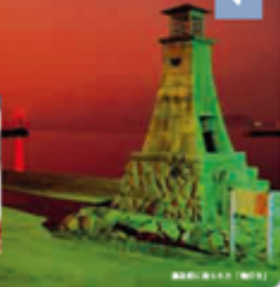
新緑の松山市(松山市)

水郷の城下町「伊予の小京都」 大洲メンバーは 互いに強い絆を持って 自己研鑽、地域貢献、進行中。