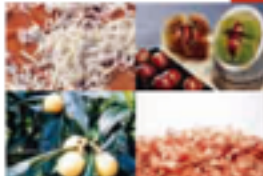
左より上、伊予産特産品「白ネギ」(1)、「産地」(2)の「カズ」(3)、産地産品「赤ピーマン」(4)、「産地」(5)

所在地 〒796-2111 松山市伊予下町1-10-12 TEL:089-922-0324