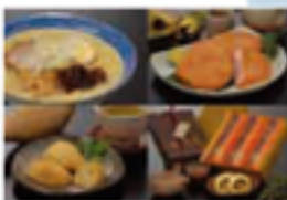
上から左がカレーうどん、右が伊予の伝統食品「おでん」。

会事務所 西分岐 50004572 所在地 〒790-0020 新居浜市西分岐4-1 西町2-4-4 TEL 0877-32-0001