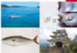
上より、瀬戸内海（宇和島）、瀬戸内海 （アノ中津島漁業）、宇和島（宇和島）

会員数 75名 会期10月まで 所在地 〒790-0000 宇和島市本島1丁目20番 TEL:0899-02-0000