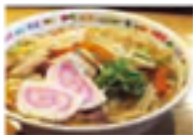
「八幡浜ちゃんぼん」が どっぶりっかつどるがてや です。

会員数 50名 会期11月まで 所在地 〒790-0000 八幡浜市本島1丁目20番 TEL:089-913-2111