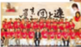
新居中央商工会議所青年部

会事務所 108号 50004572 所在地 〒796-0111 新居浜市四国中央市宮内町2-2-6 TEL 0898-08-0008