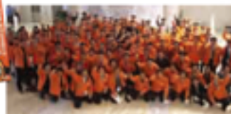
この日の盛りだくさんを持って、みなさまのまちへお祝いします。

全国大会会場に「えひめ松山大会」のキャラバン隊が到着し、会場を盛り上げます。また、会場内には「えひめ松山大会」のグッズも販売します。また、会場内には「えひめ松山大会」のグッズも販売します。また、会場内には「えひめ松山大会」のグッズも販売します。