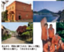
左より上、伊予産特産品「白ネギ」(1)、「産地」(2)の「カズ」(3)、産地産品「赤ピーマン」(4)、「産地」(5)

所在地 〒796-0012 大洲市法皇町4-1 TEL:0893-24-4711