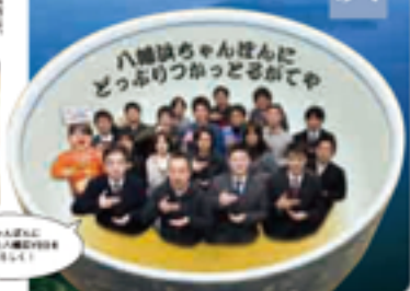
「八幡浜ちゃんぼん」が どっぶりっかつどるがてや です。

この町は、かつて中心部が海に突き出た半島にあり、昔は海産物の産地として栄えた。その歴史を今も残している。また、この町には、多くの文化財や史跡があり、その歴史を今も残している。