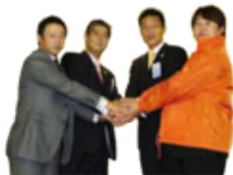
全国大会への思いを胸にパートナーシップを確立し、4人はびっ りと握手を交わした。