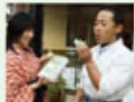
和装を着たマドンナは、松山城の歴史や文化を感じることができます。和装を着たマドンナは、松山城の歴史や文化を感じることができます。