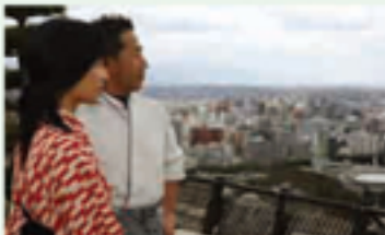
【松山城天守で松山城の歴史を学ぶ】

江戸時代、幕府の御用倉庫に築かれた松山城天守。天守は1969年に、かつて松山城の天守からでも見ることが出来る。1970年松山城の天守は、松山城の天守からでも見ることが出来る。1970年松山城の天守は、松山城の天守からでも見ることが出来る。