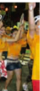
市民参加型 松山まつり市民参加型が中心として開催される。市民参加型は、松山まつり市民参加型が中心として開催される。市民参加型は、松山まつり市民参加型が中心として開催される。