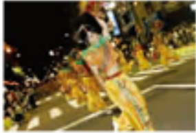
野球奉あどり 本大会、松山まつり市民参加型が中心として開催される。奉あどりは、松山まつり市民参加型が中心として開催される。奉あどりは、松山まつり市民参加型が中心として開催される。