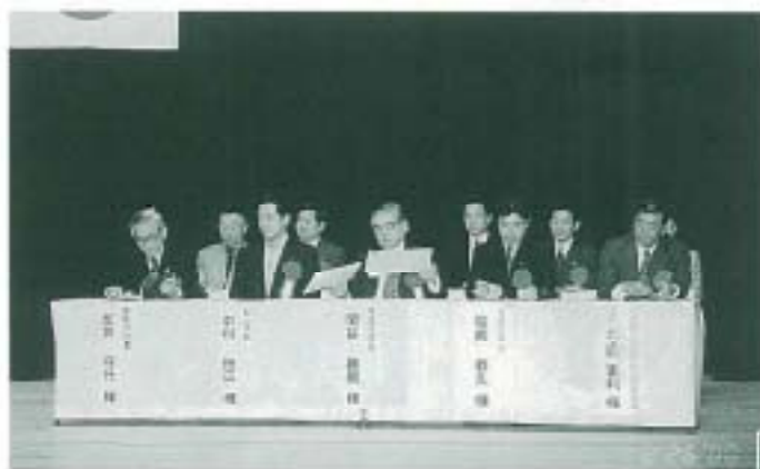
御来賓の方々から祝辞をいただきました。