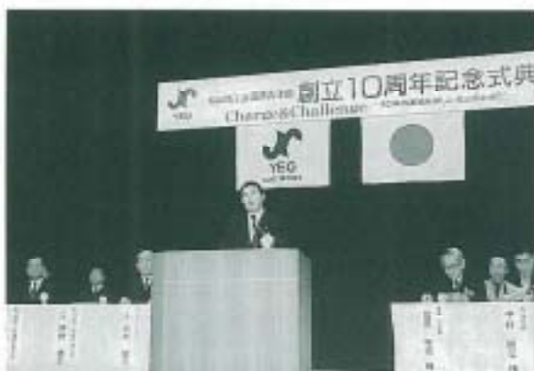
あいさつする伊狩会長