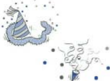
▼いや〜んモーニング娘