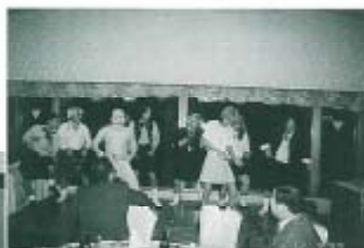
▲優勝した渉外委員会

12月例会、臨時会員総会に引き続き平成11年度忘年会が行われた。なんとと言ってもメインは、恒例の委員会対抗かくし芸大会である。何日も前から準備、練習を重ねてきたかくし芸を各委員会が発表した。各委員会とも健闘したが、優勝は渉外委員会となった。