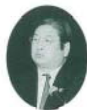
株式会社船井総合研究所 代表取締役副社長