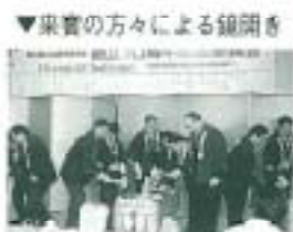
▼果實の方々による鎮開き